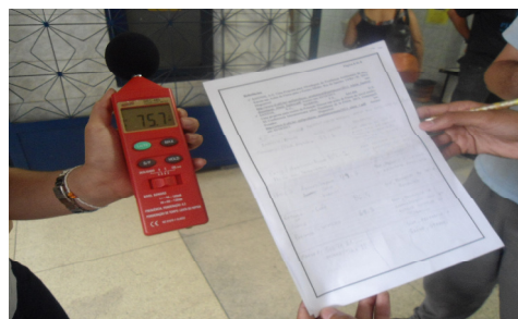
Foto 2: Grupo de alunos realizando e registrando medidas de níveis sonoros na escola.

Quanto aos 3º e 4º dias, ocorrerá a realização de atividade experimental pelos grupos da turma, possibilitando-os pensar sobre a relevância das medidas experimentais para a Física, identificar os locais da escola onde os níveis sonoros são mais elevados e levantar seus prejuízos para a saúde humana mediante relatos de diferentes membros de comunidade escolar. Apresentamos na Foto 2 um dos grupos realizando e registrando medidas de níveis sonoros na escola e a indicação de seu valor em certo ambiente com o decibelímetro.