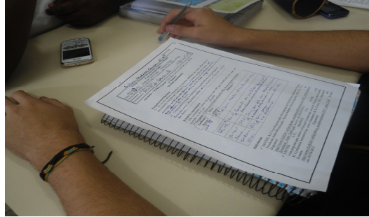
Foto 3: Relatório experimental preenchido por grupo de alunos com informações sobre níveis sonoros e relatos de pessoas na escola.

puderam preencher uma tabela presente no relatório experimental, conforme pode ser visto na Foto 3.