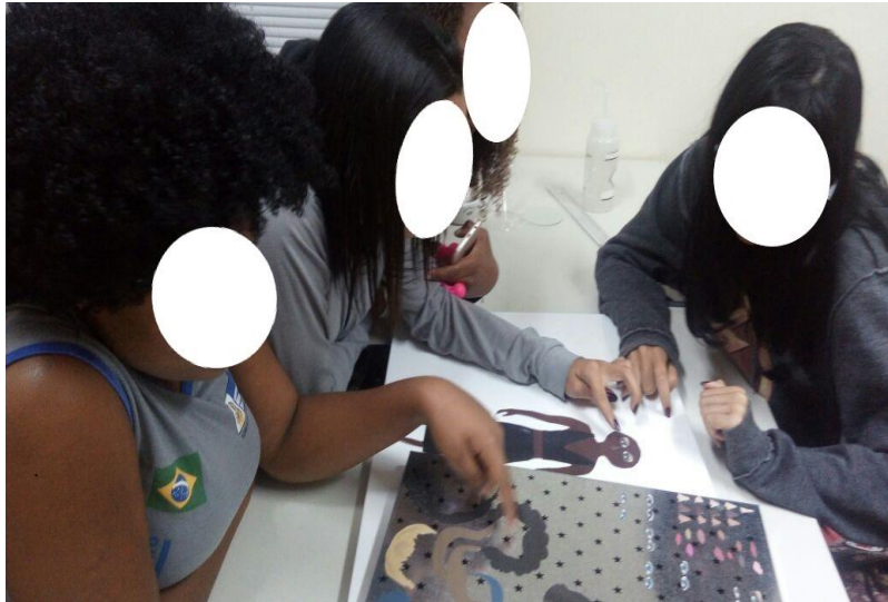
Figura 3: Registro das alunas do terceiro grupo selecionando as características de sua modelo.

representadas pelo modelo que criaram. Ao não se sentirem representadas por suas próprias personagens, foi possível iniciar um debate a respeito de padrões, pertencimento a um grupo e construção de identidades.