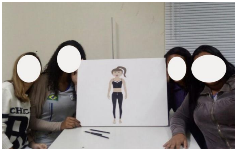
Figura 4: Resultado final da modelo elaborada pelas alunas do primeiro grupo.

Já em relação aos estereótipos de gênero foi possível observar que, ao atribuir profissões às personagens, os grupos demonstraram preferência por áreas relacionadas à saúde ou à beleza física. Quando interrogadas sobre o porquê da não escolha de profissões do campo das ciências exatas, o primeiro grupo afirmou que a modelo elaborada (Figura 4)