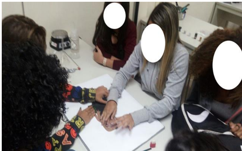
Figura 2: Registro das alunas do segundo grupo debatendo as características de sua modelo.

A partir disso, é atribuída ao grupo a tarefa de criar um novo padrão de beleza para uma suposta nova sociedade. Assim, elas selecionam as peças, adicionando características às suas “modelos” de acordo com as suas concepções de padrão de beleza, em um quadro magnético (Figura 2), porém não há a possibilidade de mais de um grupo escolher as mesmas características corporais.